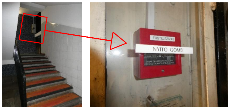
2. kép: Hő- és füstelvezetést, menekülést biztosító távnyitó