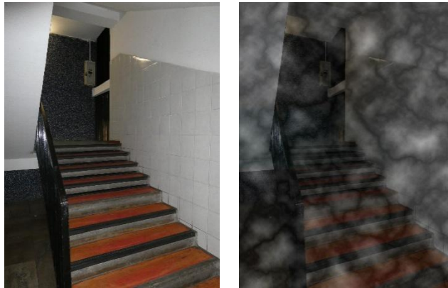
1. kép: Menekülési útvonal, a keletkező füst látást korlátozó hatása