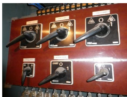
5. kép: Az épület tűzeseti fő kapcsolói