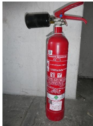
3. kép: Hordozható tűzoltó készülékek különböző típusai